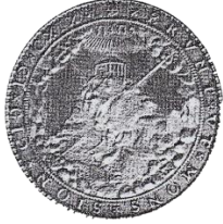
Gedenkpenning gemunt ná de Sinode van Dordrecht in 1619. Die inskrywing om die rand lees: Hulle sal soos die berg Sion wees.