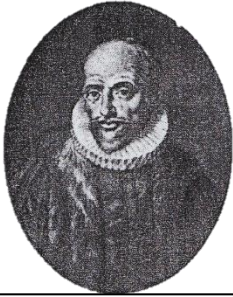
Arminius, teen wie se dwaalleer die Sinode van Dordrecht besluit het.

Omdat dit daar gegaan het om die hartaar van ons Bybelse belydenis: die belydenis van Gods genade .